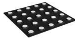
Плитка тактильная контрастная со сменными рифами черный/желтый