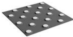
Плитка тактильная контрастная со сменными рифами серый/желтый