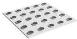
Плитка тактильная контрастная со сменными рифами желтый/черный

(Введен дополнительно, Изм. N 2), (Измененная редакция, Изм. N 3).