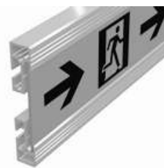
Фотолюминесцентная разметка линейная