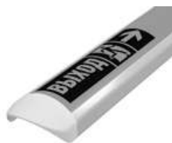
Фотолюминесцентная накладка на поручень