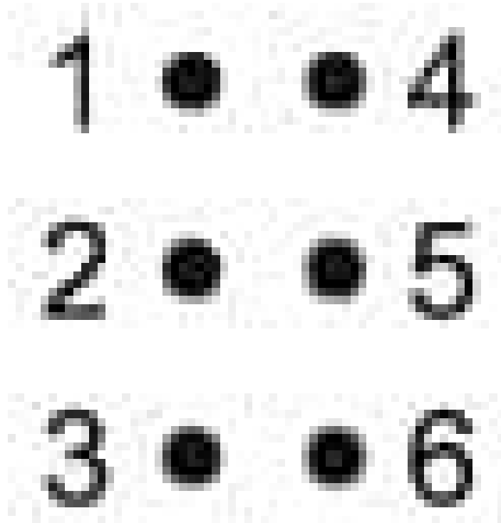
Рисунок 1 - Основная координатная сетка шрифта Брайля.

Для облегчения объяснения структуры знака точки пронумерованы в соответствии с рисунком 1: